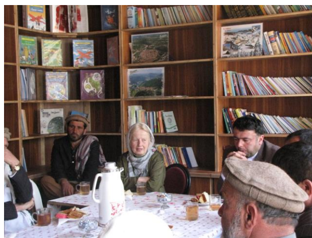
Sangona : Inauguration de la bibliothèque