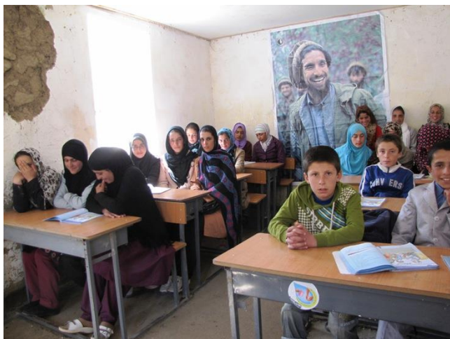
Choba : Classe mixte de Cinquième