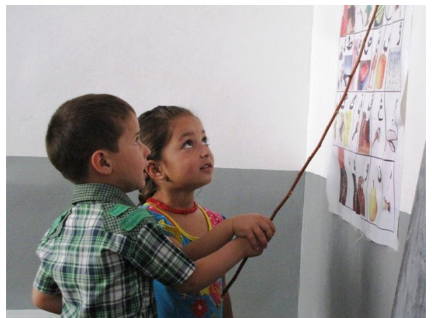
Travail de groupe à la Maternelle