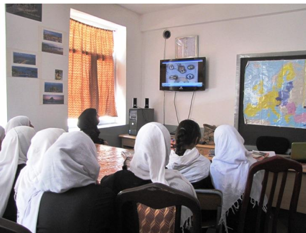
Cours de biologie à la bibliothèque

Grâce aux parrainages , nous continuons à organiser le transport des élèves des villages de Karbochi, Kanda et Goac ; 4 nouvelles élèves sont arrivées en Cinquième, et 6 sont maintenant en Seconde. Notre voiture transportant cette année 23 élèves, il va falloir en louer une plus grande pour l'année prochaine. Nous avons aussi fourni des tenues de sport aux élèves parrainées qui font partie des équipes de volley du lycée.