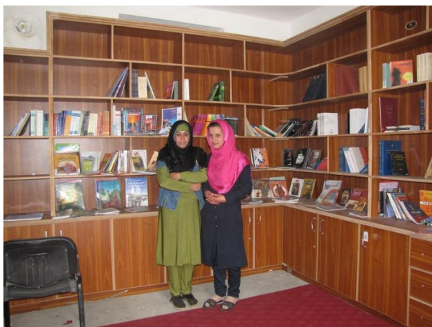
Malaspa : 2 professeurs dans la bibliothèque

Nous avons aussi fait don d'une imprimante et d'un ordinateur au lycée de filles de Tambana que nous avons entièrement aménagé en 2012.