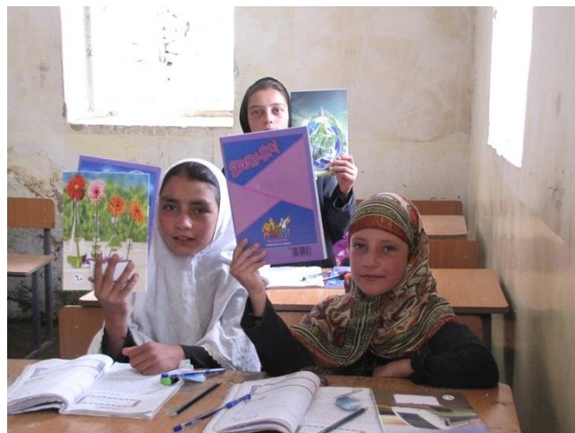
Choba : Distribution de fournitures scolaires