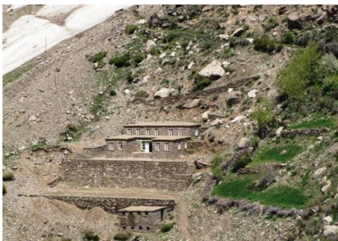
Choba : Avant les travaux